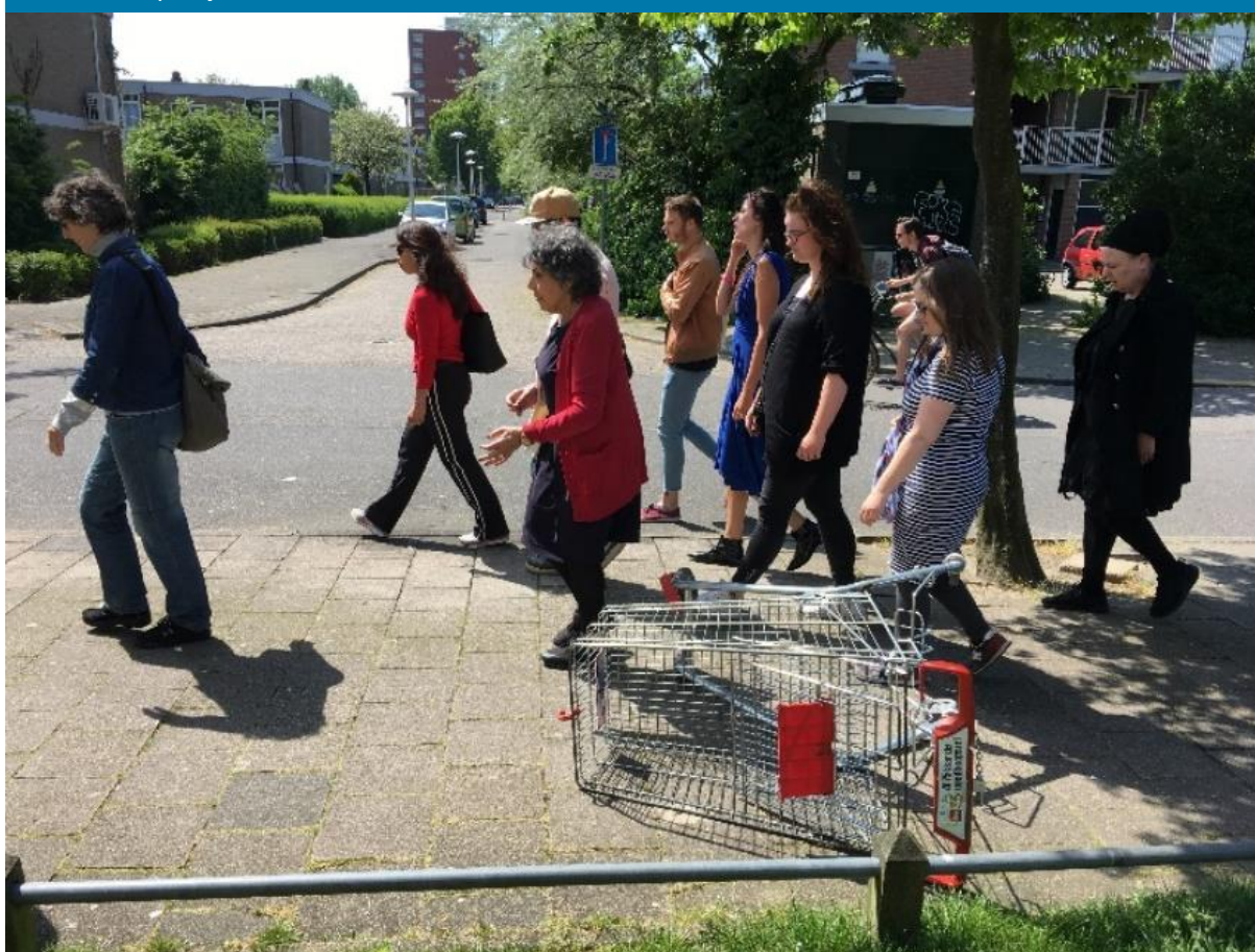
Bezoekers op WijkSafari

“[...] soms had ik het gevoel dat het iets meer over de wijk zou kunnen gaan. Het is best ingrijpend, een AZC in je wijk. Maar er zijn talloze mooie initiatieven in Overvecht gekomen voor de asielzoekers. Terwijl hier heel veel protest was. Dus er is enorme omwenteling geweest in deze wijk, dus ik had eigenlijk gedacht dat we daar iets meer mee hadden gekund. Maar het is heel erg naar het AZC getrokken.”