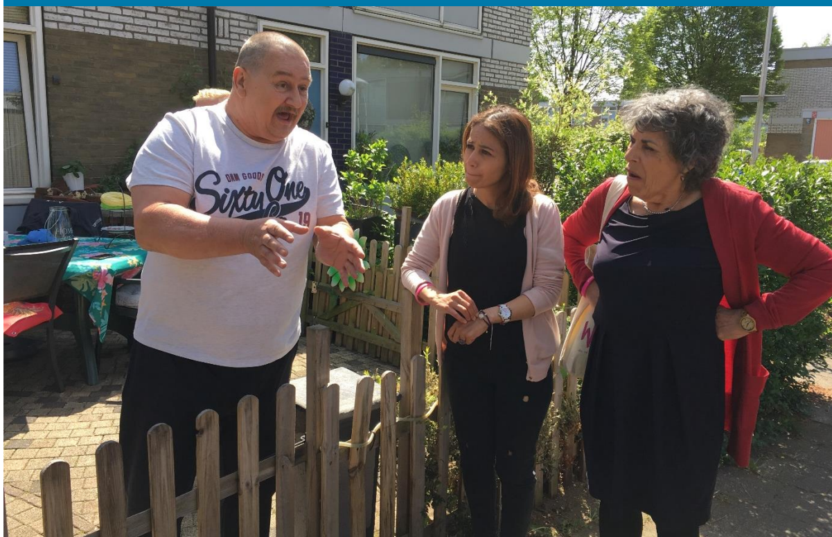
Een actrice en adoptieouder in gesprek met een wijkbewoner tijdens WijkSafari AZC

Het bereiken van een divers publiek is een uitdaging waar de theater- en cultuursector in den brede mee worstelt. WijkSafari AZC laat weer zien hoe moeilijk dit is: hoewel Zina ernaar streeft een breed publiek aan te trekken, en dit publiek probeert te bereiken via publiciteit en communicatie 26 , is het toch het “klassieke” theaterpubliek dat de WijkSafari gevonden heeft. Dit komt wellicht mede door de prijs van het kaartje (€35,-), doordat WijkSafari AZC zo snel uitverkocht was, en wellicht door de verkoop via Stadsschouwburg Utrecht.