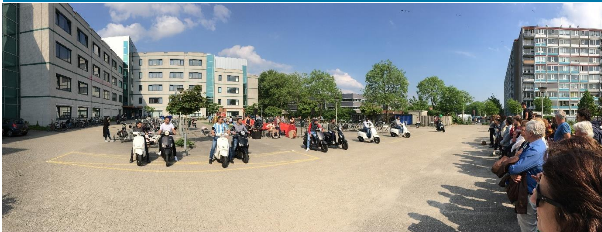
De slotact op het plein bij het AZC

Waar wordt gesproken over deelnemers , worden daarmee de personen bedoeld die op welke manier dan ook een actieve rol in de voorstelling hebben gehad. Dit kan gaan om medewerkers van Zina, adoptieouders, of andere personen uit de wijk die een rol hebben gehad. Dit zijn niet de bezoekers (zie ook paragraaf 1.6).