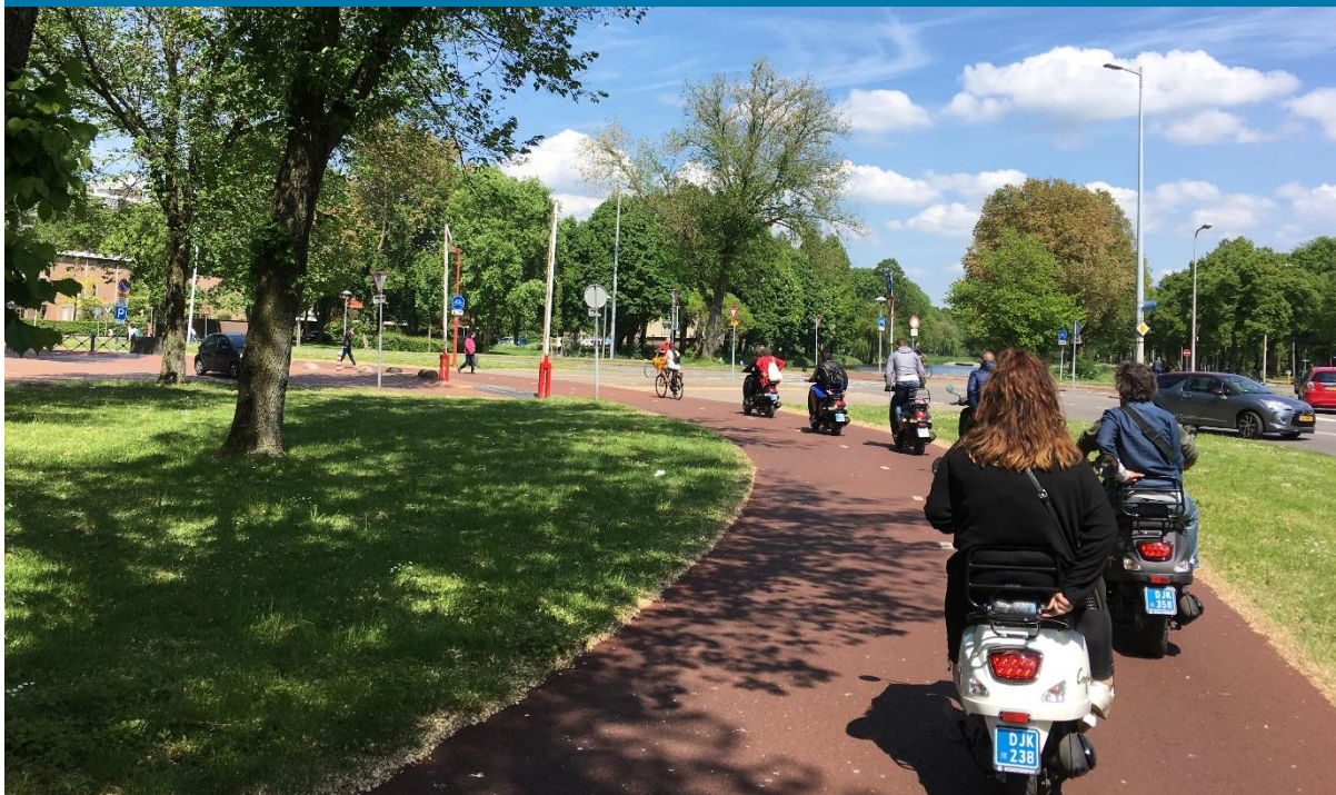
Achterop de scooter

De bezoekers zijn tijdens het afnemen van de korte vragenlijst tevens gevraagd naar een moment in de voorstelling die er voor de bezoeker uitsprong, en waarom. Veel (vaker dan 20) genoemde momenten waren hierbij: