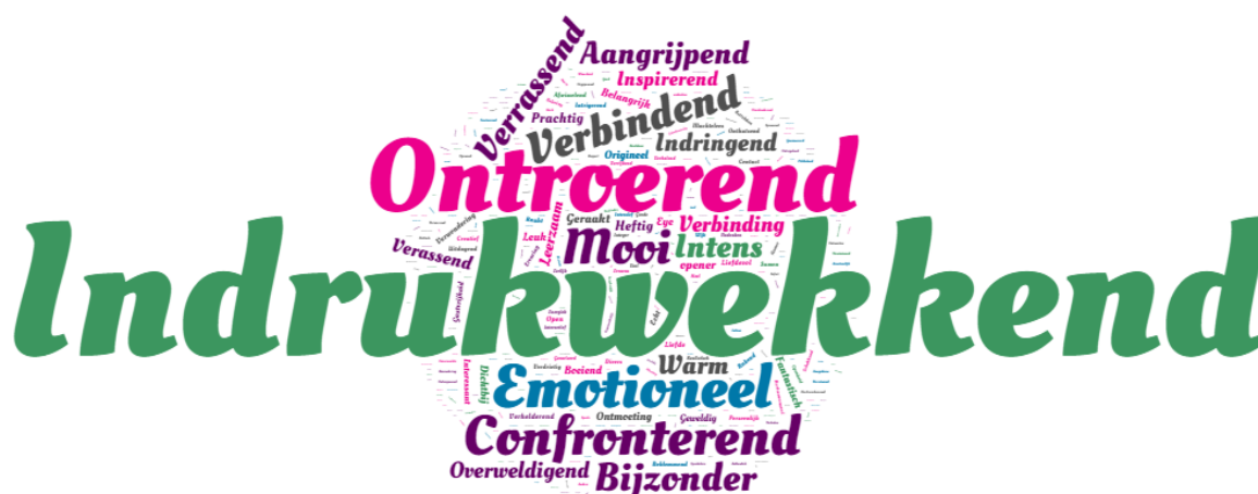
Figuur 5: WordCloud

Figuur 5 toont een zogenaamde WordCloud met overzicht van de woorden die bezoekers hebben genoemd als antwoord op de vraag om de voorstelling in drie woorden te omschrijven. De grootte van de woorden staat hierbij in verhouding met het aantal keer dat een woord is genoemd. De genoemde woorden liggen erg in elkaars verlengde en hebben veelal betrekking op de emoties die het bij de bezoeker oproept. Het wekt indruk, ontroert, is emotioneel, confronteert, et cetera.